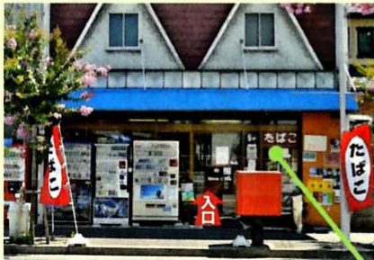
▲正面からの店舗風景

【立地】鉄道最寄駅から徒歩10分の住宅街、県道(バス路線)に面する。 【店主要望】お客様を店内へ誘導したい。菓子・飲料類などの兼業から、将来的には専門店へシフト。