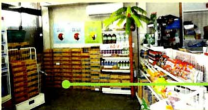
▲店内売場と陳列・ストック

店内売場(約13坪)は広く、陳列にもボリュームがあり、申し分ないのに、道路側の自販機やポスター等で、店内が見えず、お客様が入りづらい雰囲気です。