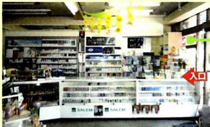
▲店内売場と陳列(右側が入口)

店舗ファサードの壁面に一切の看板類が無いため、お店の存在を示す強力なインパクトが不足しています。